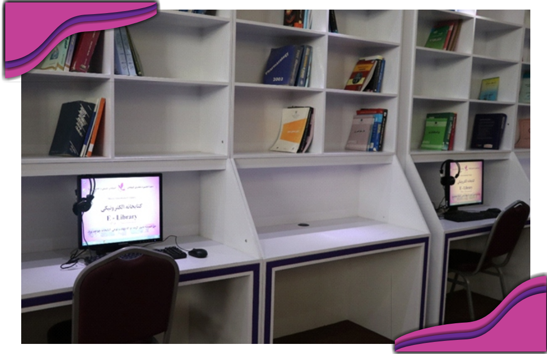
کتابخانه عمومی پوهنځی اقتصاد