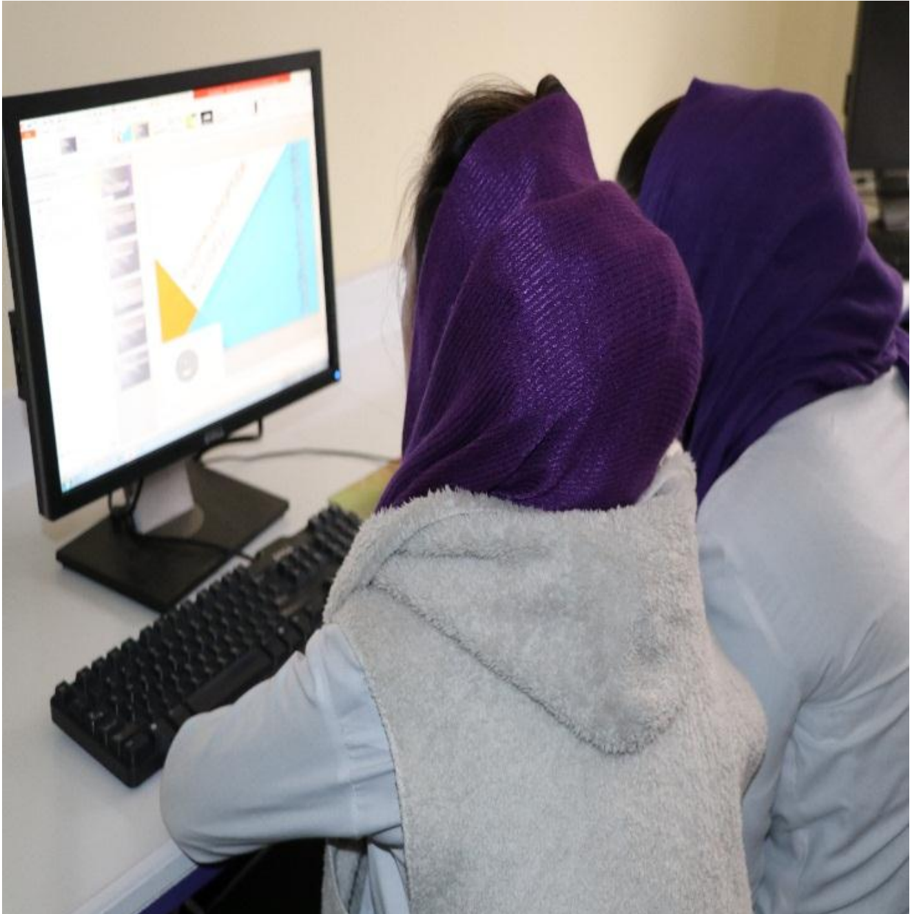
جریان کار محصلان در computer lab (IT):

موسسه تحصیلات عالی زنان افغان مورا دارای یک مرکز معلوماتی تکنالوجی یا آی تی و سه لابراتوار مجهز کمپیوتر میباشد، که یکی از این لابراتوارها بطور کامل در دسترس پوهنځی طب معالجوی قرار دارد. لابراتوار متذکره با 50 پایه کمپیوتر مجهز بوده، و از آن در تدریس مضامین کمپیوتری استفاده میگردد. بادر نظر داشت تعداد محصلین، لابراتوار مذکور جوابگوی 100% نیازمندی های کمپیوتری محصلین میباشد.