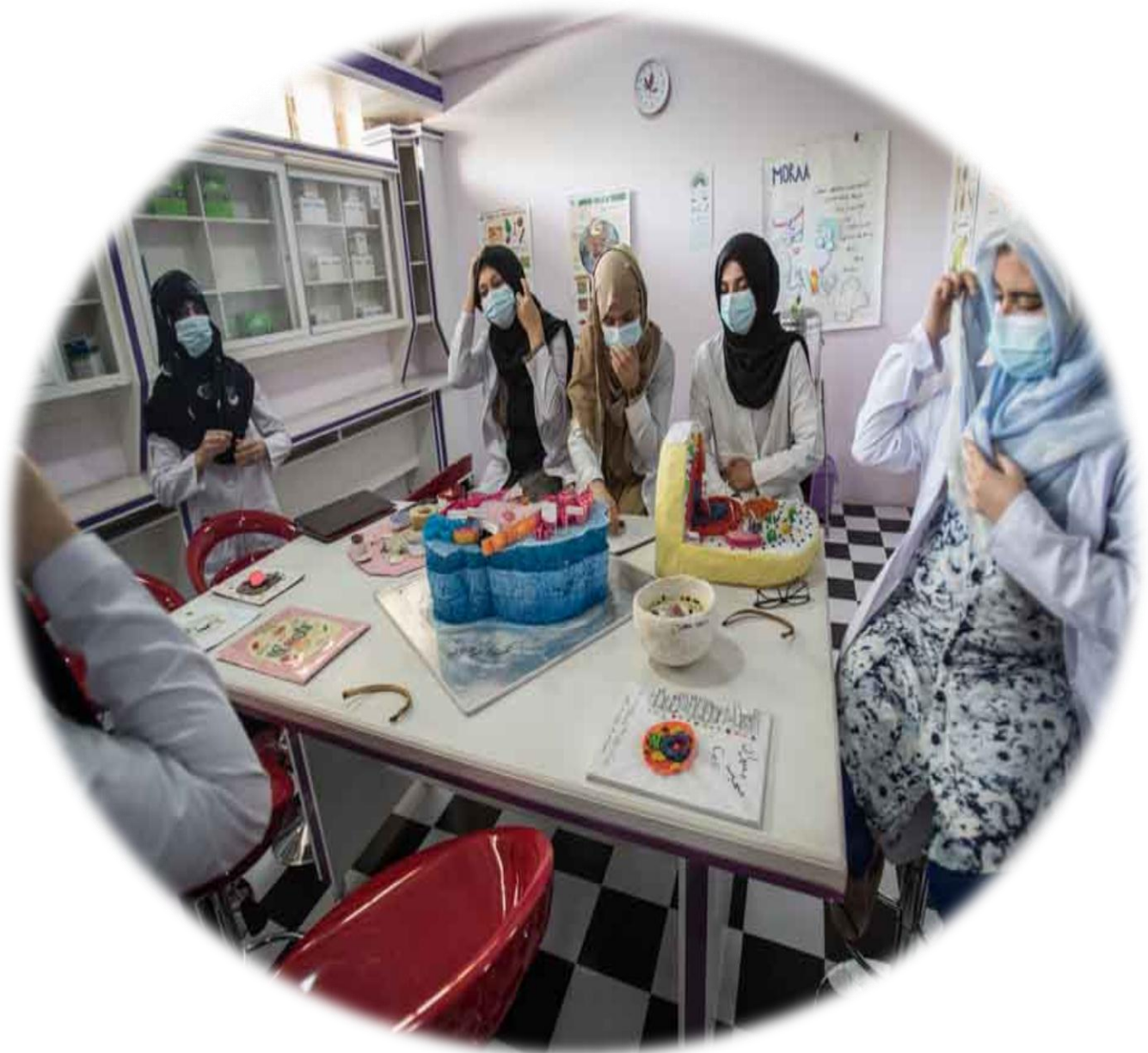
جریان کار عملی محصلان در لابراتوار هستولوژی