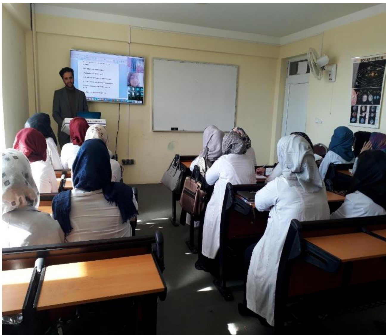
جریان لکچر استاد در صنف درسی

پوهنځی طب معالجوی موسسه تحصیلات عالی بی بی عایشه دارای فضای مناسب ، صنوف مجهز به وسایل آموزشی و امکاناتی مثل تخته سفید ، پروژکتور ، LCD، چوکی های مناسب و نور کافی می باشد. برای مضامین تشریحی، جریان تدریس از طریق آماده نمودن (پاور پابنت) استفاده میگردد، اما قابل ذکر است که، بیشتر دروس این پوهنځی کارهای عملی را نیز در بر دارد لذا لابراتوار های مجهز برای مضامین مختلف در نظر گرفته شده است، تا محصلین بتواند در فضای مناسب دروس خویش را فراگیرند. برای گرم کردن صنوف درسی از مرکزگرمی و برای سرد نمودن آن از پکه ها و ایرکنديشن ها استفاده صورت میگیرد. کیفیت تخته های سفید و میز و چوکی های صنوف از کیفیت عالی برخوردار می باشد.