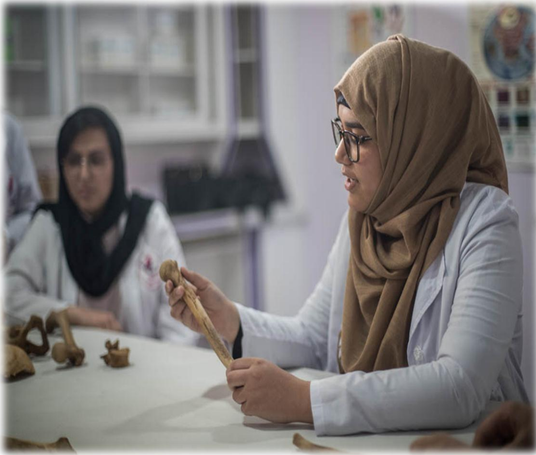
کار عملی پاراکلینیک